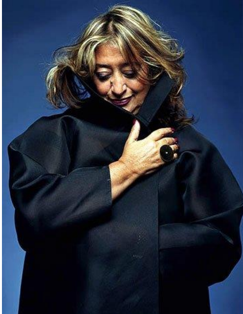
Рисунок 0.1 Заха Хадид

Заха Хадид - единственная женщина-архитектор, ставшая лауреатом премии Притцкера (2004 год). Премия широко известна в мире и считается аналогом Нобелевской.