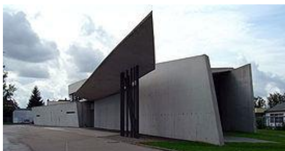
Рисунок 2.1 Пожарная часть мебельной компании Vitra

осуществлённых разработок становится пожарная часть мебельной компании Vitra, напоминающая бомбардировщик «Стелс» (1993). По словам самой Хадид, всплеск интереса к ее творчеству начался после того, как в 1997 году был построено здание музея