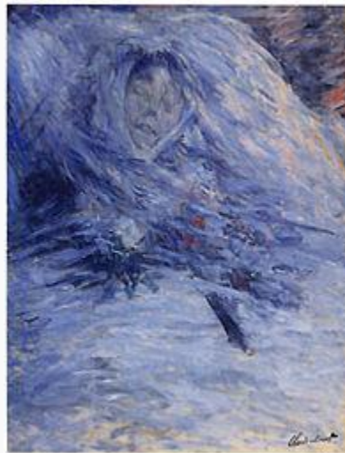
Клод Моне. Камилла на смертном одре

С декабря 1871 по 1878 год Моне жил в Аржантей, селе на правом берегу реки Сены близ Парижа, популярном для воскресных прогулок парижан, где он написал некоторые из наиболее известных его работ. В 1874 году он на короткое время вернулся в Нидерланды.