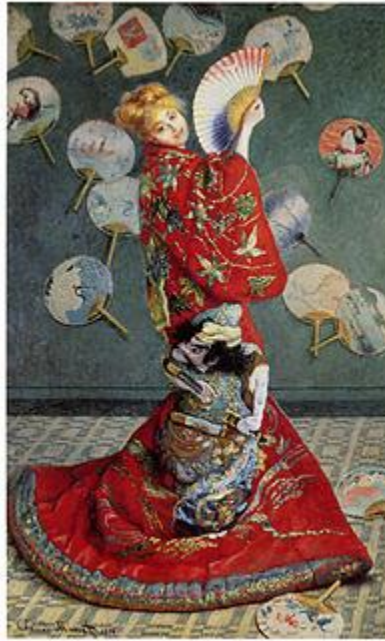
Клод Моне. Камилла в японском кимоно