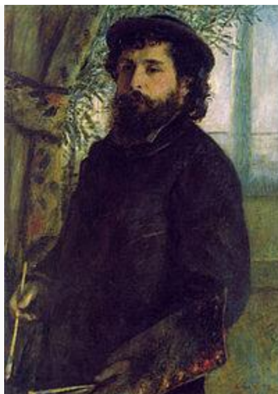
(Огюст Ренуар). Портрет Клода Моне. 1875.

Известность Моне принёс портрет Камиллы Донсьё, написанный в 1866 году («Камилла, или портрет дамы в зелёном платье»). Камилла 28 июня 1870 года стала женой художника. У них родилось два сына: Жан (1867 год) и Мишель (17 марта 1878 года).