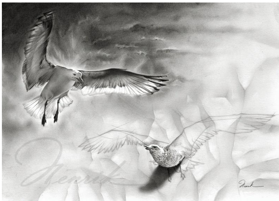
Рис. 4 «Inspiration»

Автор говорит: «Прочитав книгу Джонатан Ливингстон «Чайка», я очень вдохновился».