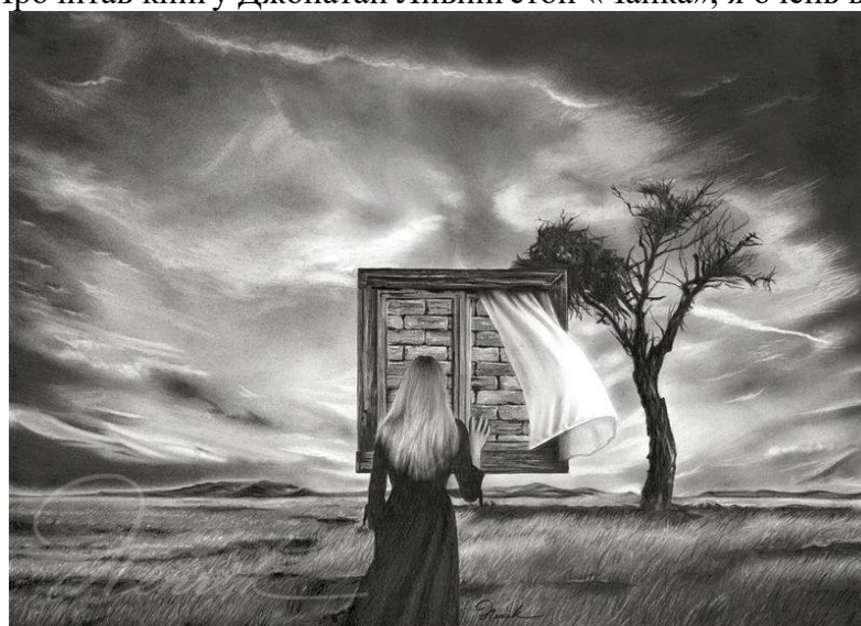
Рис. 5 "The Waiting"

Автор говорит: «Прочитав книгу Джонатан Ливингстон «Чайка», я очень вдохновился».