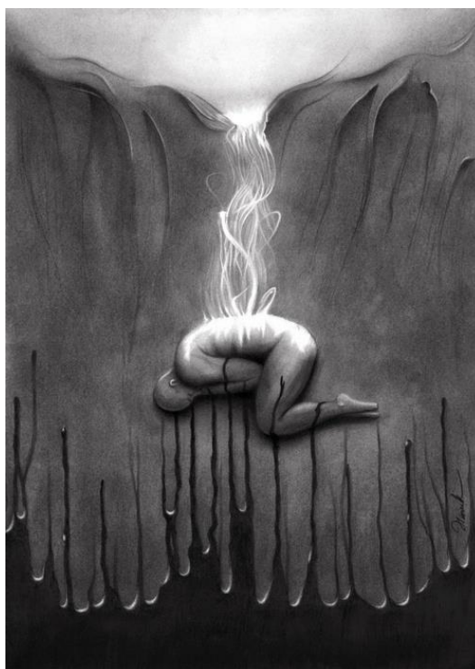
Рис.1 «The Birth».(30x40 см, графитный карандаш. 30 часов)

От руки он делает эскизы и зарисовки, в большей мере для удовольствия или учебы. Но для качественной работы он использует сетку. Работы на заказ он делает более тщательно, потому что клиенту должно все понравиться. Самым трудным в работе художника считаются фоны. Очень много нужно терпения, чтобы закрашивать большие площади. Художник жалуется, что основной проблемой есть управление идеями, которые плавают вокруг его головы. Решать выбрать одну или придерживаться другой идеи, которая, кажется, не много лучше. И так постоянно.