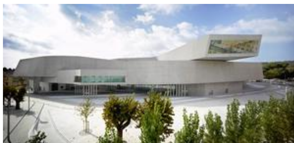
Рисунок 8-Национальный музей искусств XXI века Рим, Италия (1998 - 2009)

В мае 2010-го в Риме открылся Национальный музей искусств XXI века. Строительство обошлось в 150 миллионов евро и на тот момент являлось самым крупным зданием из всех спроектированных Захой. В том же году этот музей получил приз Стирлинга за лучшее архитектурное оформление и был назван лучшим зданием года (по версии WAF). Этот год вообще стал одним из самых удачных для Захи Хадид. Ее фирма обеспечена заказами на десятилетие вперед, уже сейчас ведется строительство около двадцати объектов по всему миру. В 2011-ом планируется открытие Оперного театра в Гуаньчжоу, а к летним Олимпийским играм 2012-го года в Лондоне будет закончено строительство спорткомплекса для водных видов спорта. Времена, когда ее здания не хотели строить в Соединенном Королевстве, давно прошли. Заха проиграла битву при Кардиффе, но выиграла войну в столице своей второй родины — Великобритании.