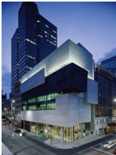
Рисунок 4-Центр современного искусства Цинциннати, США (1997 - 2003)

Ситуация неожиданным образом изменилась, когда в 1997-ом по проекту Фрэнка Гери был построен знаменитый Музей Гуггенхайма в Бильбао. Набрал силы, деконструктивизм вошел в моду. На Заху снова обратили внимание, и она получила заказ на строительство Центра современного искусства в Цинциннати, который сам по себе превращается в произведение искусства, а спустя два года по ее проекту начинается строительство лыжного трамплина в Инсбруке. Заха на практике доказывает, что ее фантастические идеи можно сделать реальными. Постепенно она становится востребованным архитектором. Ее политика творческого самовыражения, превалирующего над принципами эргономики и функциональности, но не подавляющего их, начинает приносить свои первые плоды. Она приступает к строительству научного центра Phaeno и центрального здания завода BMW (оба в Германии), ее проекты побеждают в конкурсах и не сходят со страниц архитектурных журналов. Заха продолжает преподавать и ездит с лекциями по всему миру, неизменно собирая полные аудитории.