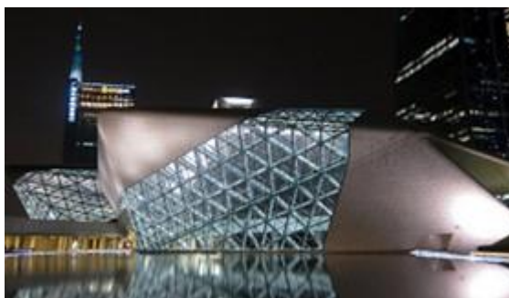
Рисунок 9-Оперный театр Гуаньчжоу, Китай (2003 - 2010)

Сама Заха говорит о своем творчестве так: «Я пытаюсь передать эмоции, которые испытывает человек, оказавшийся в дикой природе, в незнакомом, неисследованном месте. Постигание природы не имеет ничего общего с линейной системой координат... Мне интересно создать пространство, где у вас есть выбор системы координат. Когда вы оказываетесь в дикой природе, у вас нет определенного маршрута, и вы обнаруживаете места и вещи, которые не стремились обнаружить. Иногда вы чувствуете себя потерянным, но это лишь акцентирует внимание на том, что есть и другие пути. Многих людей не устраивает такой подход, потому что вообще люди не любят ставить под сомнение свои представления о правильном и неправильном. Мне, напротив, больше всего нравится менять свои мнения. Это как раз та причина, по которой люди путешествуют, смотрят мир, экспериментируют. И меня очень удивляет, насколько люди привержены какому-то одному способу существования. Это надо менять, и причем менять постоянно».