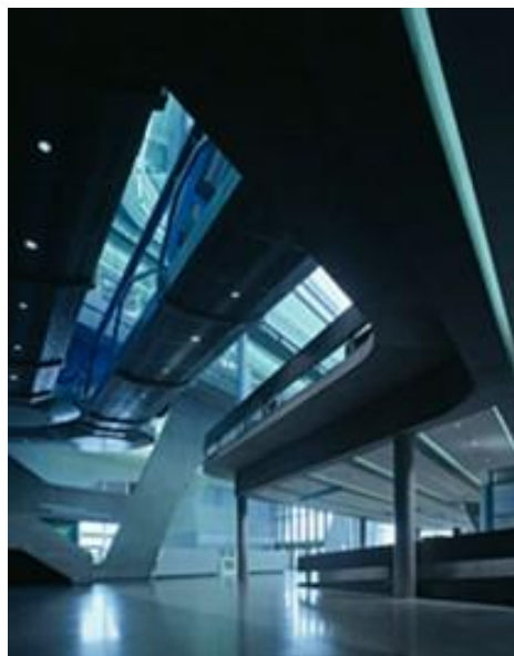
Рисунок 5-Центральное здание завода BMW Лейпциг, Германия (2001 - 2005)