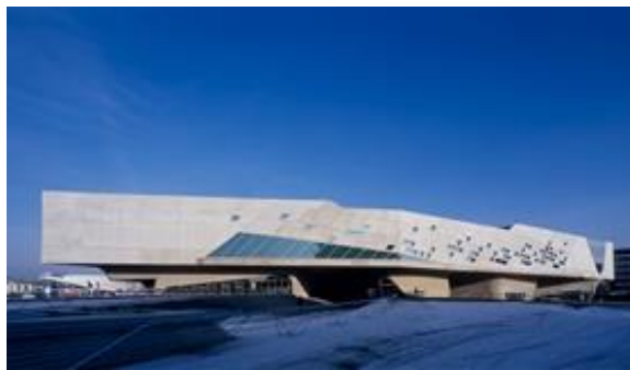
Рисунок 6-Музей естественных наук Phaeno Вольфсбург, Германия (2000 - 2005)

В 2006-ом прошла персональная выставка в музее Гуггенхайма в Нью-Йорке, посвященная тридцатилетию карьеры Захи Хадид. Значительная часть представленных на ней проектов существовали уже не только на бумаге, но и реально строились по всему миру. Музей естественных наук Phaeno в Вольфсбурге вошел в список лучших архитектурных сооружений 2006 года и был отмечен премиями имени Мис Ван дер Роэ и Стирлинга. Заха называет этот проект в числе своих самых любимых: «Phaeno — это наиболее законченное изложение моих поисков комплексности, динамики, многослойности архитектурного пространства». Музей напоминает космический корабль, парящий в воздухе вопреки всем законам гравитации, да и саму Заху иногда называют «инопланетянкой» и даже «колдуньей». Люди, которые встречались с ней лично говорят, что фотографии совершенно не передают ее демоническую красоту и духовную силу. У нее, как и у всех талантливых людей, много врагов, но даже самые непримиримые ее противники признают, что многие работы Захи поистине великолепны. Тридцать лет назад вряд ли кто-нибудь осмелился сказать такое про женщину-архитектора, но Заха коренным образом изменила ситуацию. В 2010-ом году Прицкеровскую премию снова получила женщина — японка Кадзуо Седзима. Сегодня это уже никого не удивляет и не вызывает такого ажиотажа, как в случае с Захой, потому что она была первопроходцем.