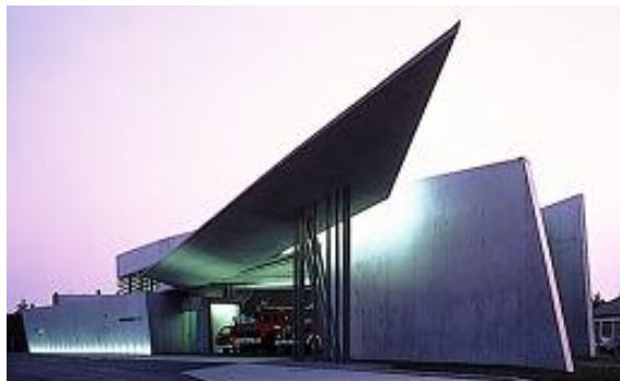
Рисунок 3-Пожарная часть Virta Вайль-на-Рейне, Германия (1990 - 1994)

Продолжавшаяся целое десятилетие черная полоса заканчивается в 1990-ом году, когда Заха получает заказ на строительство пожарной части компании-производителя дизайнерской мебели Virta. Это необычное здание, похожее на бомбардировщик «Стелс», стало событием в архитектурном мире и заставило говорить о Захе как о мастере сформировавшегося в конце 80-х течения деконструктивизма. Вскоре Заха выигрывает конкурс на строительство Оперного театра в заливе Кардифф (Великобритания), однако под давлением недовольной общественности заказчик аннулирует результаты конкурса и назначает новый, в котором Заха снова одерживает победу, обойдя в общей сложности 268 конкурентов. Тогда заказчик вообще отказался от проекта, и долгожданный триумф обернулся для Захи катастрофой. Ее карьера достигла низшей точки. Работы практически не было, но Заха не сдавалась. Она решила идти до конца.