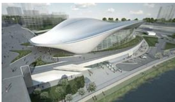
Рисунок 10-Центр водных видов спорта Лондон, Великобритания (2005 - 2011)

В начале своей головокружительной карьеры Заха ставила перед собой задачу продолжить незаконченный проект модернизма в экспериментальном духе раннего авангарда. В русских авангардистах ее привлекал дух отваги, риска, новаторства, стремления ко всему новому и вера в мощь изобретательства. От фрагментарной архитектуры своих ранних проектов, создававшихся под влиянием творчества Малевича и Кандинского, она постепенно перешла к сложным текучим формам, в которых все сильнее проявляется органиче-