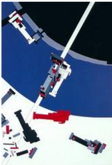
Рисунок 2-Тектоник Малевича (1977)

В этот период Заха страстно увлекается русским авангардом и в особенности творчеством великого русского художника Казимира Малевича. Много лет спустя она скажет, что мечтает повесить «Черный квадрат» у себя в гостиной. Дипломная работа Захи так и называлась «Тектоник Малевича» и представляла собой проект обитаемого моста над Темзой. Заха применила оригинальный подход к работе, отказавшись от проекций, и стала использовать живопись как метод проектирования. Ей не нравится, что современные студенты почти не умеют рисовать, предпочитая пользоваться компьютером. Заху научила азам живописи ее мать, и для каждого своего проекта она делает по несколько сотен набросков, из которых потом рождается новый архитектурный шедевр.